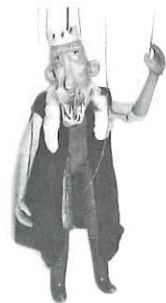
幼 兒 戲 偶 教 學 工 具 書