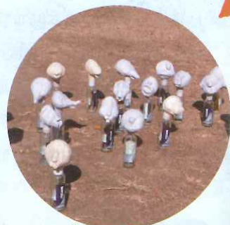
4. 将做好的布袋偶头部套在酒瓶上，放在阳光下晾晒，完全晾干后再重复上一步骤（反复三次）。