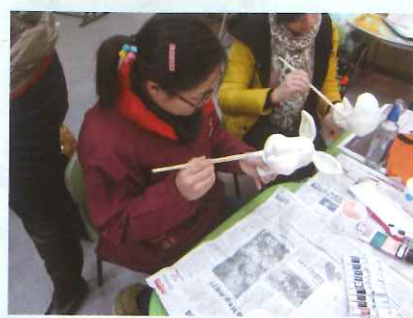
3. 将粗糙的卫生纸撕成小条，蘸取稀释后的白乳胶刷在之前塑好形的头部上。