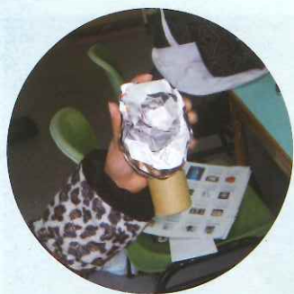
1. 先用卷纸筒和废旧广告纸做好布袋偶的头部基本形状。