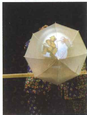
不同形式的儿童剧表演（以儿童为观众、演给儿童看的戏剧）

了解客观世界。过去，这些知识、态度、技能都由年长的亲属、邻里、坊众、族群，经过口传、身教的方式去传授。当然，还包括大量听来的故事，以及在与较年长孩童之间的游戏、争吵、打架、探索中综合成的宝贵的成长经验。而在今天，社会结构改变，小家庭普遍独立生活于小区之中，人与人之间的互动更加疏离。孩子的成长脱离了自然的物理环境和人文环境，就需要更多不同媒介的刺激。绘本，正是孩子接触世界、体验