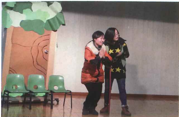
在东方娃娃2013年12月的绘本戏剧工作坊中，教师按照本文中11个步骤，展开绘本戏剧活动，图为《蛤蟆爷爷的秘诀》展演剧照。

4. 开展多个戏剧游戏，锻炼幼儿的基本能力，如“停/动作” [1] 游戏，可以让幼儿由浅入深地运用动作；“快慢轻重” [2] 游戏，可以让幼儿掌握节奏及动作的快慢；“拼合对象”游戏，幼儿在合作用身体组成各种对象及空间的过程中，能够增强