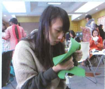
6. 让我们在等待布袋偶头部颜料干透的时间里，开始制作衣服吧！