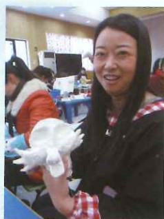
2. 用美纹纸进行简易塑形，捏出你想要的形状。