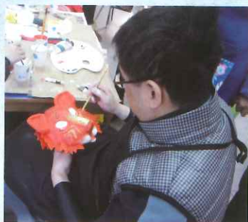
5. 用砂纸打磨后就可以上色啦，考验你画工的时候到了。