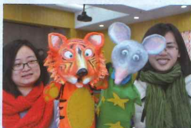
7. 将做好的衣服和头部组装起来，可爱的布袋偶就完成了！